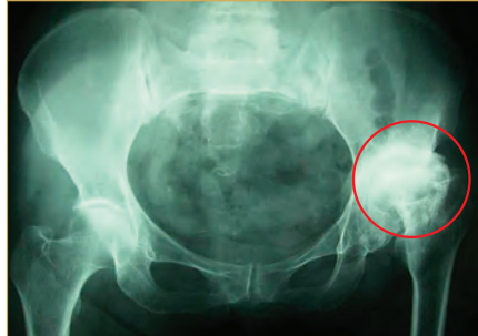
●変形性股関節症の方のレントゲン。股関節の痛みでほとんど歩けない状態で手術も考えていたが、AKAで治療後、変形はそのままでも痛みは改善された。

「インフォームドコンセントをしつかりと行い患者さんの不安を取り除き、正しい診断により治療をするこ